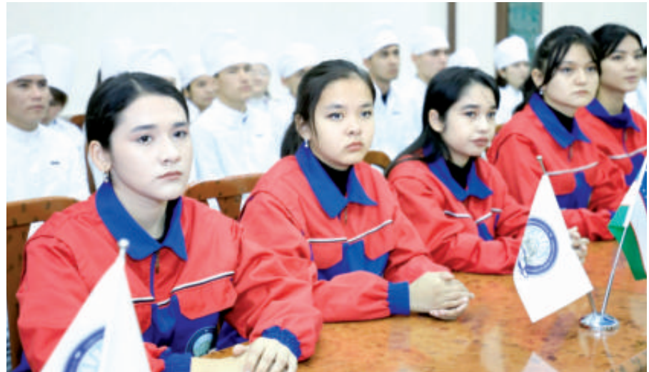
вилоятдаги 160 та тиббиёт муассасасида ўқув хоналари ташкил этилди.

Водийда ягона, мамлакатимизда ўз нуфузига эга тиббиёт институтимизда айна вақтда таълим олаётган 8702 нафар йигит-қиз юртдошларимиз саломатлигини мустаҳкамлаш, соғлом инсонлар сафини кенгайтириш, оналар ва болалар соғлигини муҳофизат қилиш, аҳоли ўртасида тиббий маданиятни тартиб этиш каби эзгу ишларни рўёбга чиқаришни мақсад қилган.