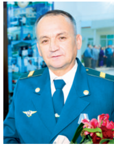
лари давлатимиз ва жамиятимизнинг мустаҳкам таянчи бўлиб хизмат қилмоқда”, деган сўзлари менга катта фахр бағишлади.

Президентимизнинг касб байраминиз муносабати билан йўллаган табригида, “Янги Ўзбекистонда “Инсон қадрини учун” деган эзгу тамойил асосида олиб бораётган ислохотларимизни ҳаётга муваффақиятли жорий этишда ички ишлар тизими ходим-