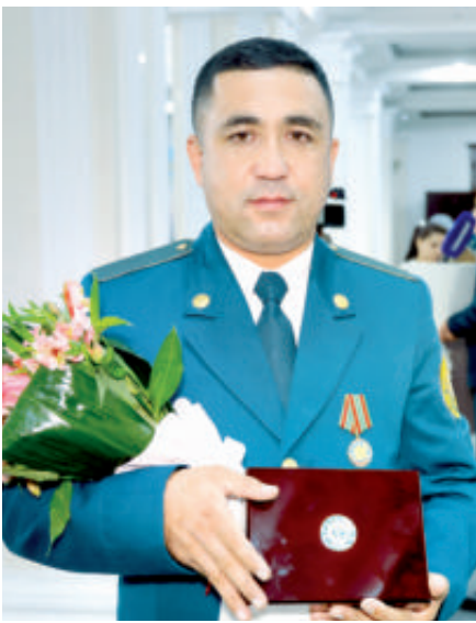
лари одамлар ички ишлар органларига нисбатан жазоловчи идора сифатида қараб, формали ходимлардан иложи борича ўзини олиб қочишга ҳаракат

қилар, мулоқотга киришмасди. Биз, ходимлар учун яратилган шароитни-ку айтмай қўя қолай. На уй-жой, на хизмат машинаси, на ойлик маош кўнгилдагидек эди.